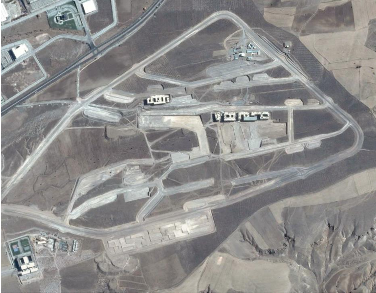
Mimar Sinan Kampüsü 2016 Yılından Uydu Görüntüsü